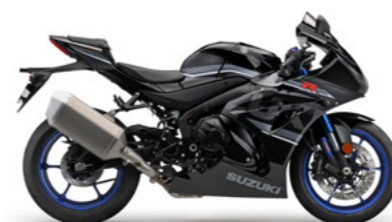
Glass Sparkle Black (YVB)