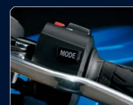
Suzuki Drive Mode Selector (S-DMS)