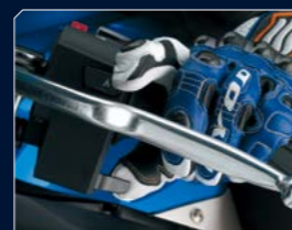
Suzuki Drive Mode Selector (S-DMS)