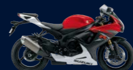
Pearl Mira Red / Pearl Bracing White (ASV)