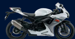
Pearl Bracing White / Metallic Mat Fibroin Gray (ARD)