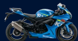
Metallic Triton Blue (YSF)