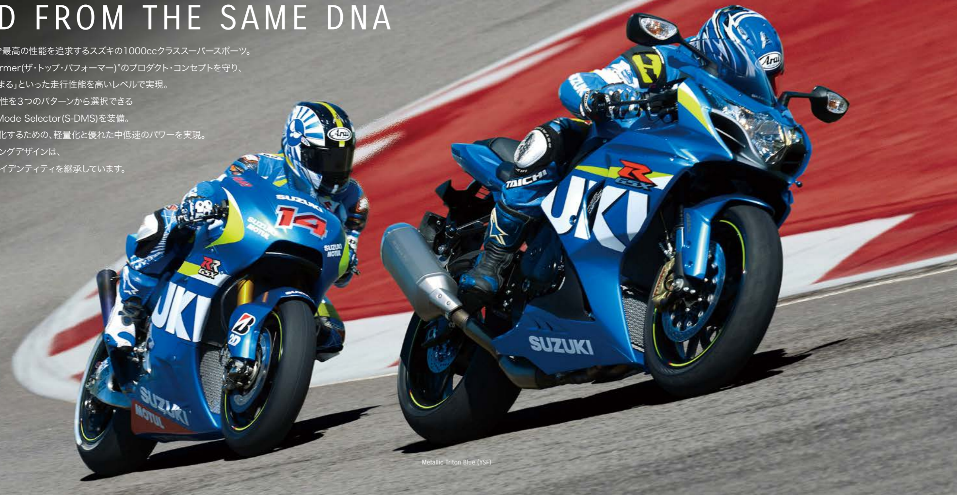
Metallic Triton Blue (YSF)

常に革新の技術で最高の性能を追求するスズキの1000ccクラススーパースポーツ。 “The Top Performer(ザ・トップ・パフォーマー)”のプロダクト・コンセプトを守り、 「走る・曲がる・止まる」といった走行性能を高いレベルで実現。 エンジンの出力特性を3つのパターンから選択できる SUZUKI Drive Mode Selector(S-DMS)を装備。 コンセプトを具現化するための、軽量化と優れた中低速のパワーを実現。 魅力的なスタイリングデザインは、 GSX-Rとしてのアイデンティティを継承しています。