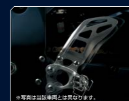
※写真は当該車両とは異なります。 3-way adjustable footpeg