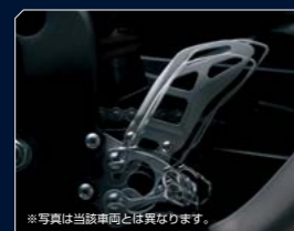
※写真は当該車両とは異なります。 3-way adjustable footpeg