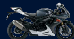
Pearl Moon Stone Gray / Pearl Bracing White (A19)