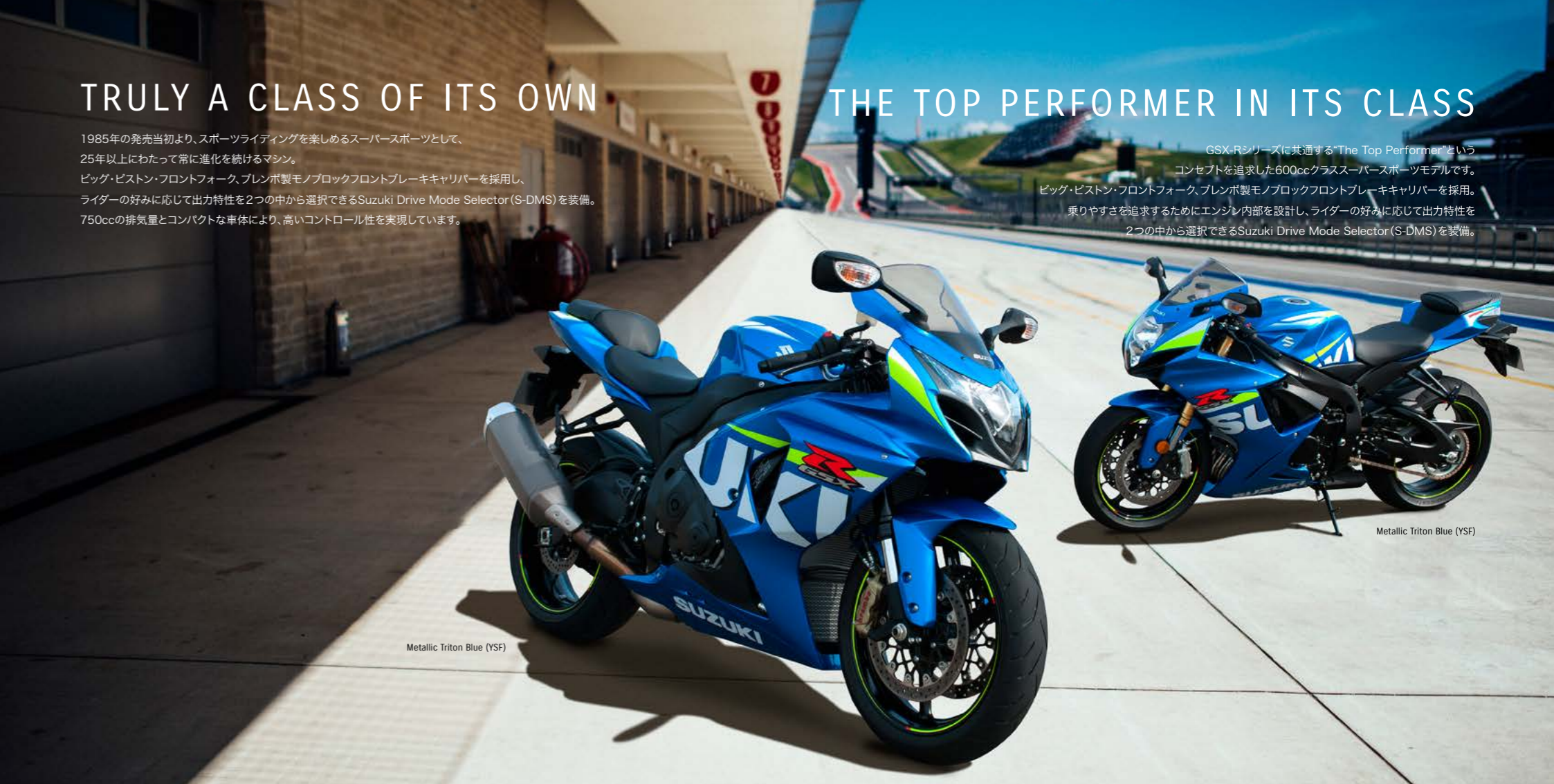
Metallic Triton Blue (YSF)

GSX-Rシリーズに共通する“The Top Performer”という コンセプトを追求した600ccクラススーパースポーツモデルです。 ビッグ・ピストン・フロントフォーク、ブレンボ製モノブロックフロントブレーキキャリパーを採用。 乗りやすさを追求するためにエンジン内部を設計し、ライダーの好みに応じて出力特性を 2つの中から選択できるSuzuki Drive Mode Selector(S-DMS)を装備。