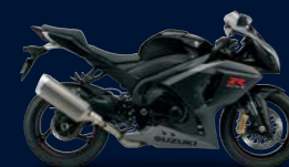
Glass Sparkle Black / Metallic Mat Fibroin Gray (AR4)