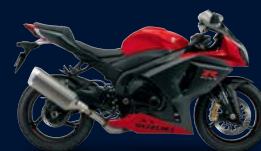
Pearl Mira Red / Metallic Mat Black No.2 (ARB)