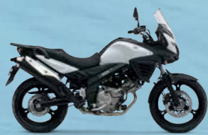
Pearl Bracing White (RB5)