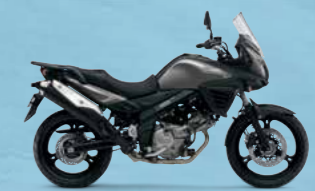
Metallic Thunder Gray (YLF)