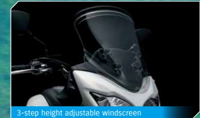
3-step height adjustable windscreen

自由度が高く快適なライディングポジション、軽量で剛性バランスに優れたアルミフレーム、トルクフルで扱いやすいVツインエンジン、安定感のあるブレーキングを実現するABS、V-Strom650ABS... それは未知なる冒険のパートナーです。