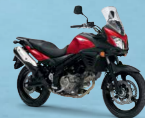
Candy Daring Red (YYG)