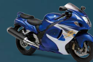
Pearl Vigor Blue / Pearl Glacier White (AJP)