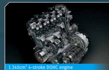
1.340cm³ 4-stroke DOHC engine