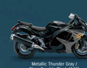
Metallic Thunder Gray / Glass Sparkle Black (AA3)