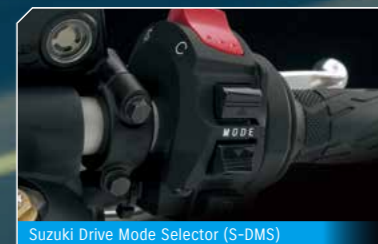
Suzuki Drive Mode Selector (S-DMS)

1999年、「ジ・アルティメット・スポーツ = 究極のスポーツ」をコンセプトに誕生した「ハヤブサ1300」。 2007年、更に高い空力特性を持つ独特なスタイリングに、排気量を1,340ccまでに拡大したエンジンを搭載。 また、ライダーの好みに応じて出力特性を3つの中から選択できる Suzuki Drive Mode Selector (S-DMS) を搭載。 新たなカラーリングを身にまとった、スズキが誇る大型スポーツモーターサイクルのフラッグシップモデル。