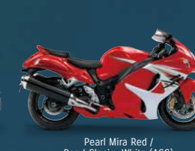
Pearl Mira Red / Pearl Glacier White (AGS)