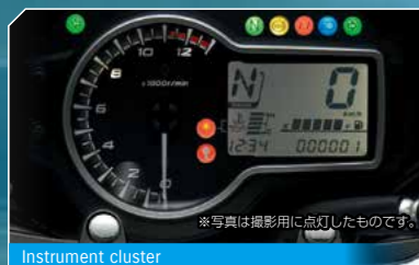
Instrument cluster *写真は撮影用に点灯したものです。