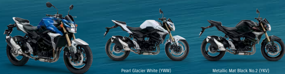
Pearl Vigor Blue / Metallic Mystic Silver (ASU)