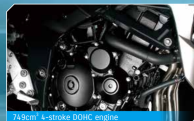
749cm³ 4-stroke DOHC engine