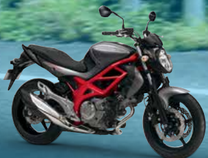
Metallic Thunder Gray / Glass Sparkle Black (AA3)