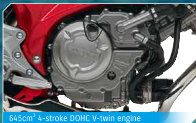
645cm 3 4-stroke DOHC V-twin engine