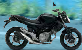
Metallic Mat Black No.2 / Glass Sparkle Black (KGL)