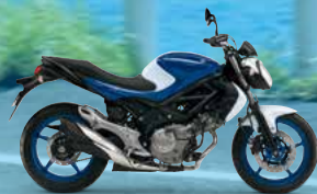
Pearl Vigor Blue / Pearl Glacier White (AJP)