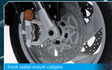
Front radial-mount calipers