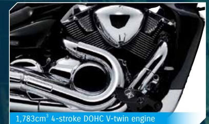
1,783cm 3 4-stroke DOHC V-twin engine