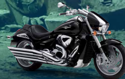
Glass Sparkle Black (YVB)