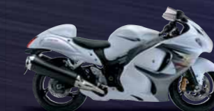
Pearl Glacier White / Metallic Oort Gray (AJM)