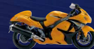
Marble Daytona Yellow / Glass Sparkle Black (KGK)