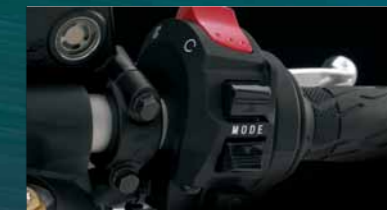
Suzuki Drive Mode Selector (S-DMS)

新たなカラーリングを身にまとった、スズキが誇る大型スポーツモーターサイクルのフラッグシップモデル。