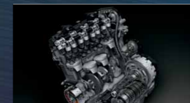
1.340cm 3 4-stroke DOHC engine