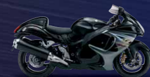
Glass Sparkle Black / Metallic Oort Gray (AJM)