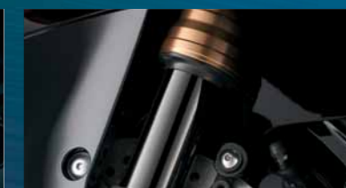
Inverted cartridge forks