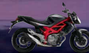
Metallic Thunder Gray / Glass Sparkle Black (AA3)