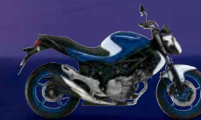
Pearl Vigor Blue / Pearl Glacier White (AJP)