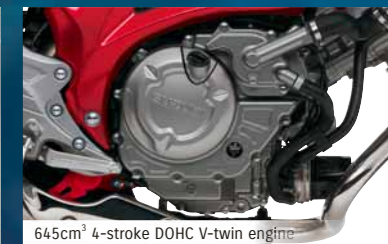
645cm 3 4-stroke DOHC V-twin engine