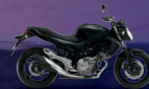
Metallic Mat Black No.2 / Glass Sparkle Black (KGL)