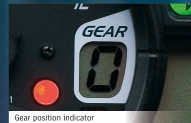
Gear position indicator