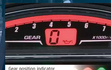
Gear position indicator