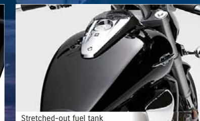
Stretched-out fuel tank