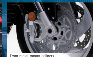
Front radial-mount calipers