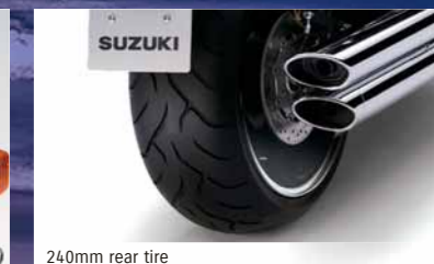
240mm rear tire