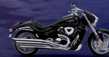
Glass Sparkle Black (YVB)