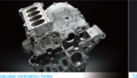
Crankcase ventilation holes