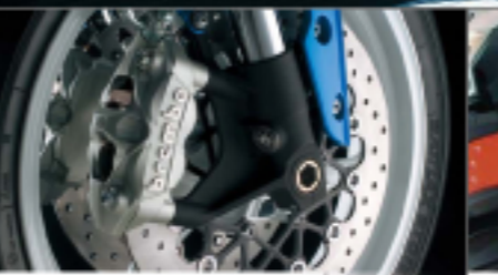
Brembo Front brake calipers