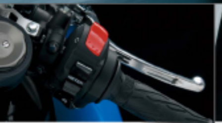
Meter display selection switch