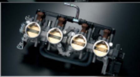
Suzuki Dual Throttle Valve (SDTV)