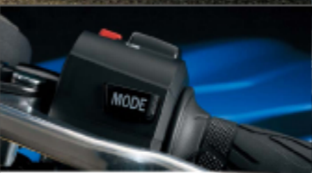
Suzuki Drive Mode Selector (S-DMS)