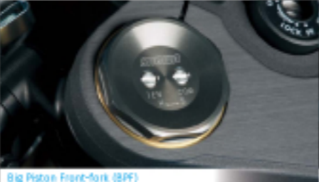
Big Piston Front-fork (BPF)