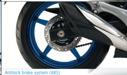
Antilock brake system (ABS)