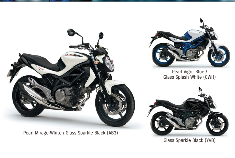
Pearl Vigor Blue / Glass Splash White (CWH)