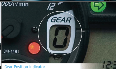
Gear Position indicator