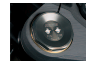
Big Piston Front-fork (BPF)