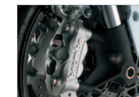
Brembo Front brake calipers