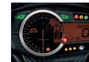
Instrument cluster ※インジケータランプは、撮影用に点灯させたものです。