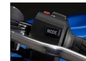
Suzuki Drive Mode Selector (S-DMS)

1985年の発売当初より、スポーツライディングを楽しめるスーパースポーツとして、25年以上にわたって常に進化を続けるマシン。 ビッグ・ピストン・フロントフォーク、 ブレンボ製モノブロックフロントブレーキキャリパーを採用し、 ライダーの好みに応じて出力特性を2つの中から選択できる Suzuki Drive Mode Selector (S-DMS)を装備。 750cm 3 の排気量とコンパクトな車体により、 高いコントロール性を実現しています。