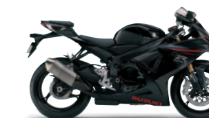
Glass Sparkle Black (YVB)