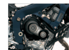
749cm 3 4-stroke DOHC engine