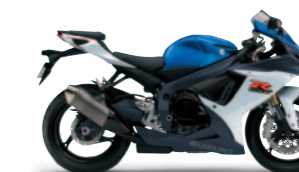
Metallic Triton Blue / Glass Splash White (GLR)