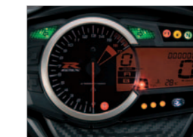
Instrument cluster ※インジケータークランプは、撮影用に点灯させたものです。