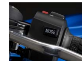
Suzuki Drive Mode Selector (S-DMS)

GSX-Rシリーズに共通する“The Top Performer”というコンセプトを追求した600cm 3 クラススーパースポーツモデルです。ビッグ・ピストン・フロントフォーク、ブレンボ製モノブロックフロントブレーキキャリパーを採用。エンジンは、モトGPマシンの部品開発技術に応用したピストンをはじめとする、最新の設計技術によりメカロス低減を図りました。乗りやすさを追求するためにエンジン内部の設計を見直すとともに、ライダーの好みに応じて出力特性を2つの中から選択できるSuzuki Drive Mode Selector (S-DMS)を装備。外観のスリムさ、コンパクトさ、性能のバランスを実現。