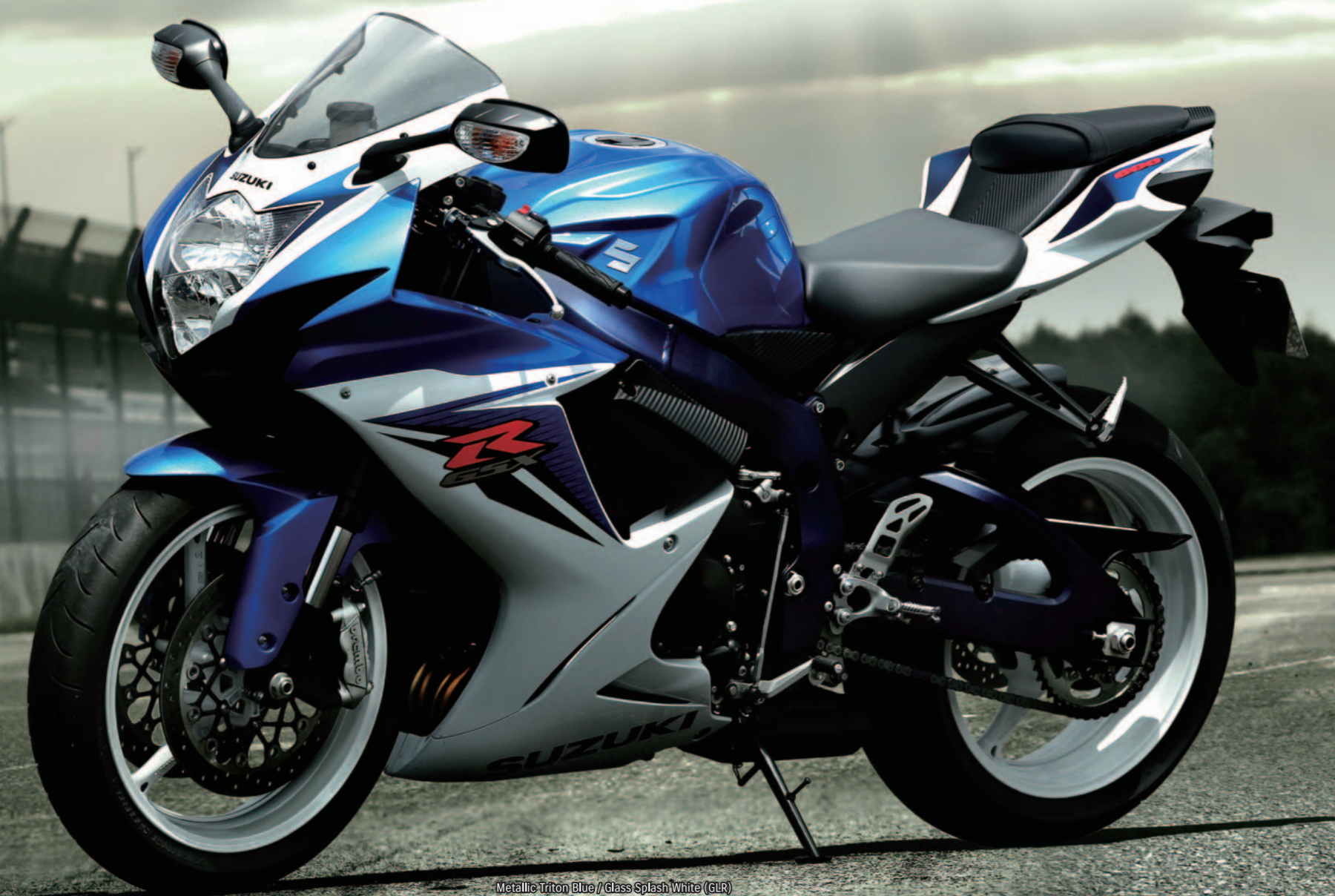
Metallic Triton Blue / Glass Splash White (GLR)