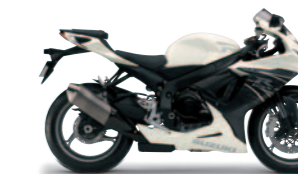
Metallic Mat Black No.2 / Pearl Mirage White (JDT)