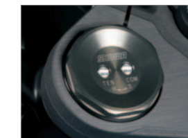
Big Piston Front-fork (BPF)