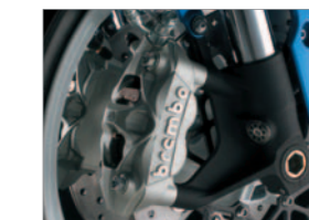
Brembo Front brake calipers