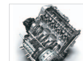
599cm 3 4-stroke DOHC engine