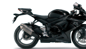
Glass Sparkle Black (YVB)