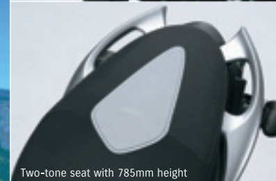
Two-tone seat with 785mm height