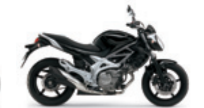
Pearl Nebular Black (YAY) Photo : GLADIUS 650ABS