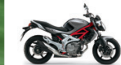
Metallic Oort Gray / Metallic Phantom Gray (CRT) Photo : GLADIUS 650ABS