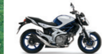
Pearl Suzuki Deep Blue No.2 / Glass Splash White (LR5) Photo : GLADIUS 650ABS