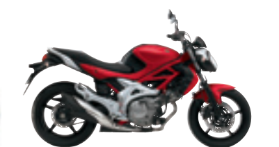
Pearl Nebular Black / Pearl Mira Red (HUZ) Photo : GLADIUS 650ABS