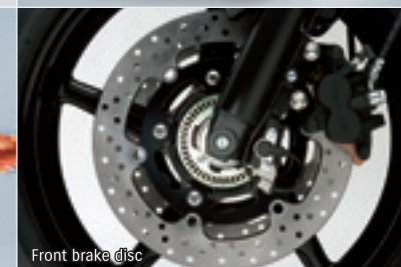
Front brake disc