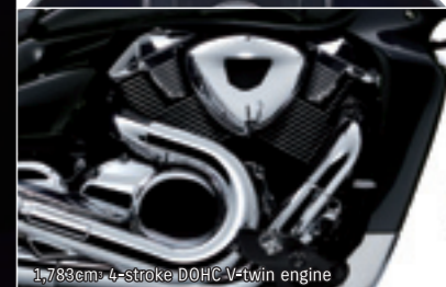
1,783cm 3 4-stroke DOHC V-twin engine