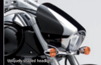
Uniquely shaped headlight

タンクからリアフェンダーへの流れるようなスタイリングと、 ハイパフォーマンスの両立をコンセプトに「スズキ ブルバードM109R」は開発されています。 超ワイドリムと240mmの極太リヤタイヤ、約3cm径のハンドルバーの採用など 車体各部に、従来のサイズを超えたパーツを採用。 また、ボア径112mmのピストンを有する1,783cm 3 高出力Vツインエンジンを搭載し、 鼓動感の強いトルクフルな走行性能を発揮します。 細部のクオリティまで徹底的にこだわり、これからのクルーザーの方向性を提案します。