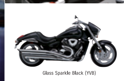
Glass Sparkle Black (YVB)