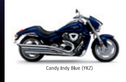
Candy Indy Blue (YKZ)