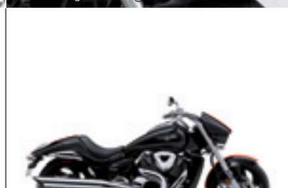
BOULEVARD M109RZ Glass Sparkle Black / Candy Max Orange (JBA)