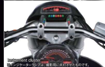
Instrument cluster ※インジケータースラフは、撮影用に点灯させたものです。