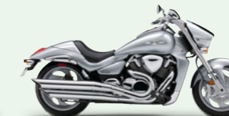
Metallic Mystic Silver (YMD)