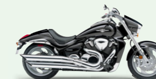
Pearl Nebular Black (YAY)