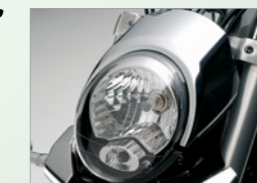
Unique-shaped round headlight