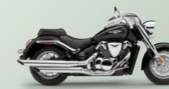
Pearl Nebular Black (YAY)