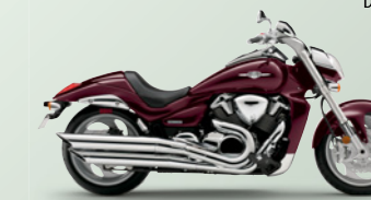
Candy Dark Cherry Red (YMK)