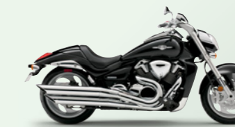
Pearl Nebular Black (YAY)