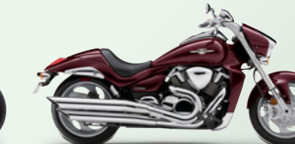
Candy Dark Cherry Red (YMK)