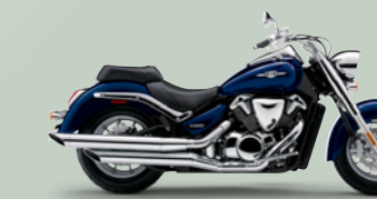
Candy Indy Blue (YKZ)