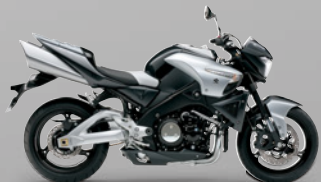
Metallic Phantom Gray / Metallic Mystic Silver (ETT)