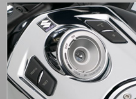
S-DMS (Suzuki Drive Mode Selector)