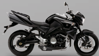
Solid Black / Metallic Mat Black No.2 (CRU)