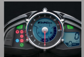
Lightweight instrument cluster